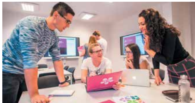
Aktivní studenti se mohou zúčastnit tzv. stínování manažerů nebo stáží ve významných podnicích, někteří také vyjíždějí na půlroční pobyty do zahraničí v rámci Erasmus+.

„Jednou z klíčových aktivit EF je zahraniční spolupráce, která umožňuje další rozvoj kompetencí studentů, prohloubení pedagogických a odborných zkušeností akademických pracovníků a zapojení do mezinárodních vědecko-výzkumných struktur. O kvalitě zahraniční spolupráce svědčí i společný navazující magisterský program Regional and European project management, který už popáté nabíral studenty do prvních ročníků. První semestr studenti stráví na Université de Bretagne Sud v bretaňském Lorientu, druhý