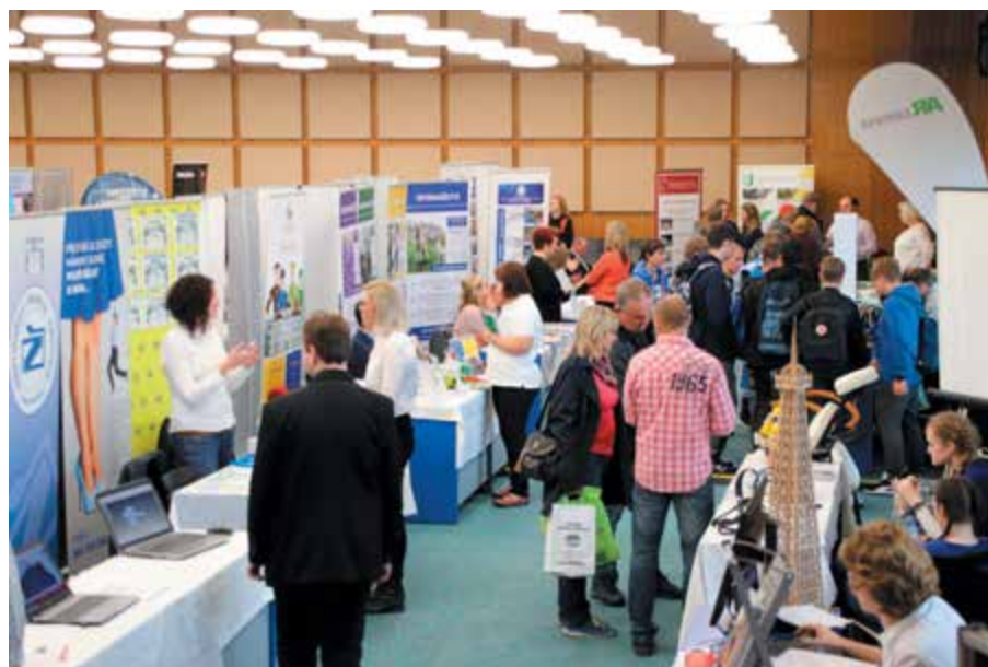
Na burze škol v Jindřichově Hradci letos vystavovalo kolem 60 škol a firem a přišlo na 900 návštěvníků z regionu.