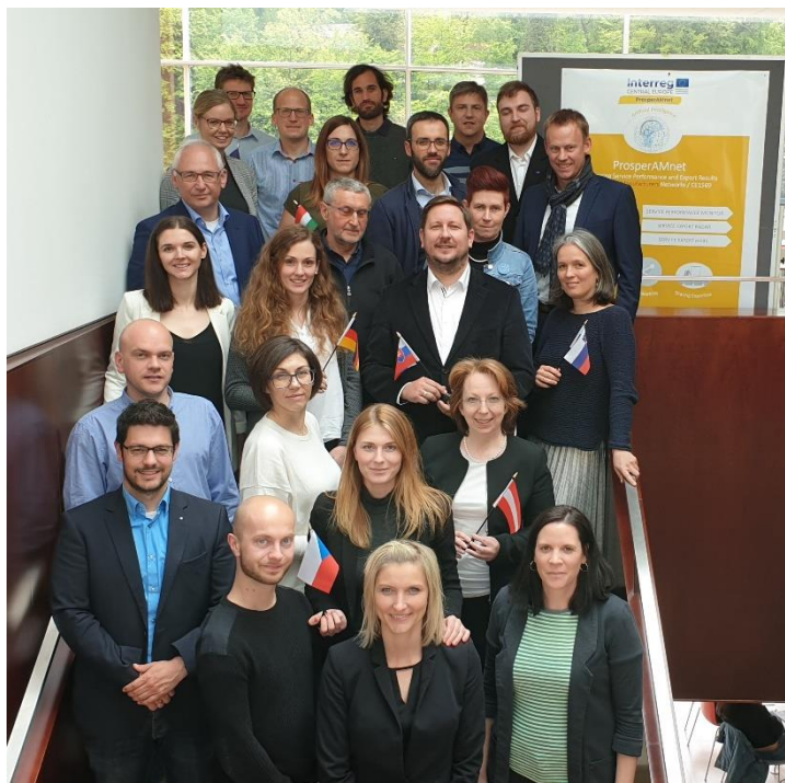
Foto partnerů z prvního meetingu ProsperAMnet 6. - 7. května 2019