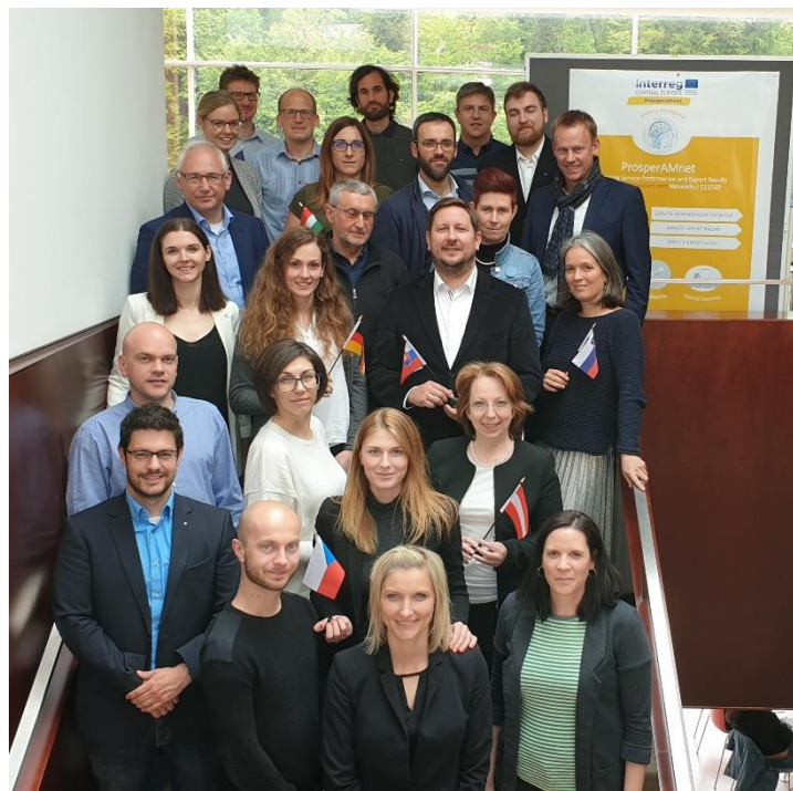
Foto partnerů z prvního meetingu ProsperAMnet 6. - 7. května 2019