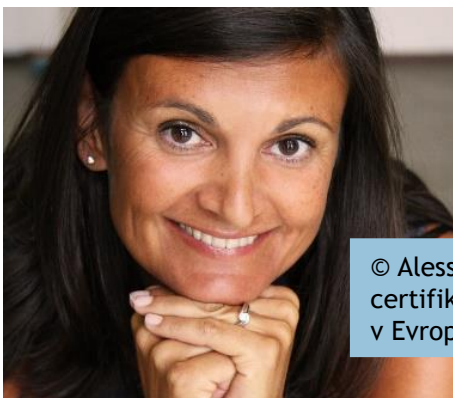
© Alessandra Gruppi, první certifikovaná manažerka servitizace v Evropě

Projekt je podpořen programem Interreg CENTRAL EUROPE financovaným z Evropského fondu pro regionální rozvoj.