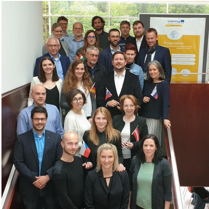
Foto partnerů z prvního meetingu ProsperAMnet 6. - 7. května 2019